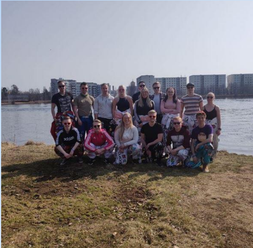
Otolaisia Wappuna kirkkovenesouduissa.

Oulun lääketieteen tekniikan opiskelijat ry eli OLTO on vuonna 1993 perustettu ainejärjestö, jonka tehtävänä on toimia lääketieteen tekniikasta kiinnostuneiden opiskelijoiden yhdyslinkkinä Oulun yliopistossa. OLTO pyrkii toiminnallaan ylläpitämään yhteyksiä niin alan yrityksiin ja asiantuntijoihin kuin muihin yliopistoihin ja muissa yliopistossa toimiviin saman alan sisarkiltoihin.